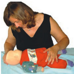
Betroffener Säugling kann nicht atmen und husten!