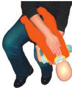
Bei gesicherter Kopftiefe bis zu 5 Rückenschläge!